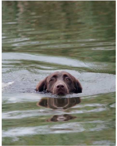
Na, wo ist denn die Ente!