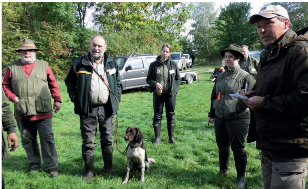
Schon wieder wird eine Leistung bewertet!