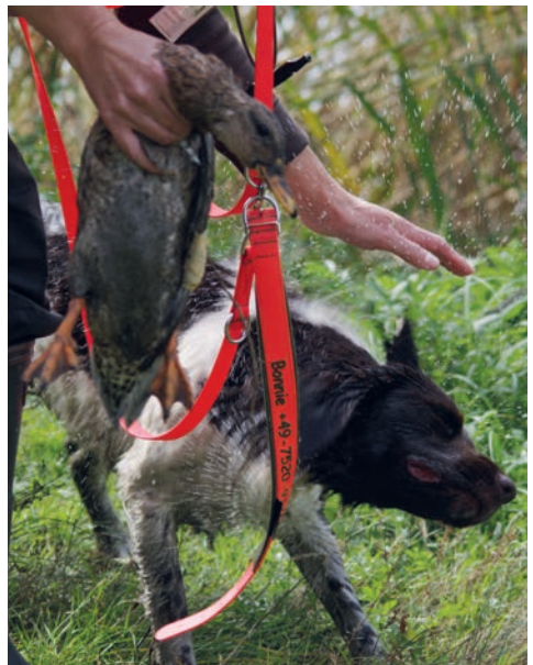
Jetzt darf ich mich schütteln!