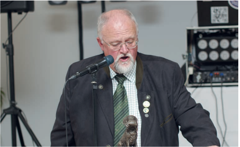
Begrüßung durch Präsident Dietrich Berning