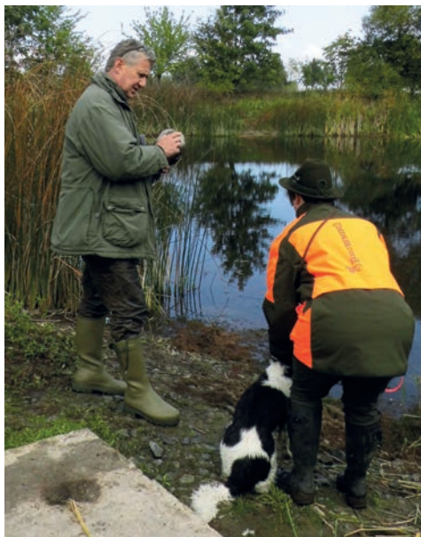
Ein letzter Hinweis vom Richterobmann