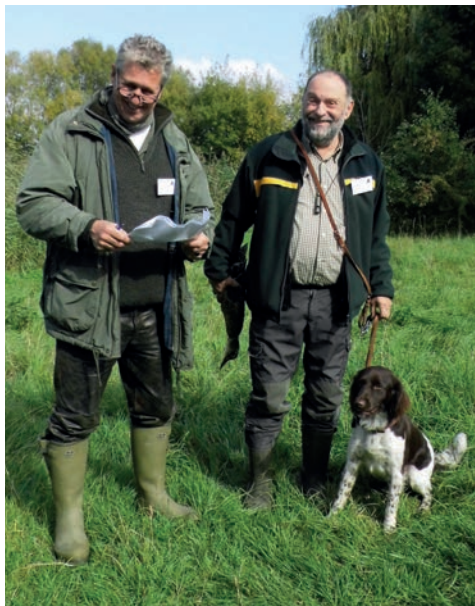
Nach Abschluss der Arbeit zufrieden!