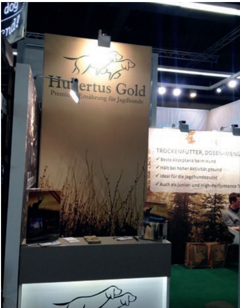
Messestand der Fa. Hubertus Gold - Werbepartner der Kleinen Münsterländer