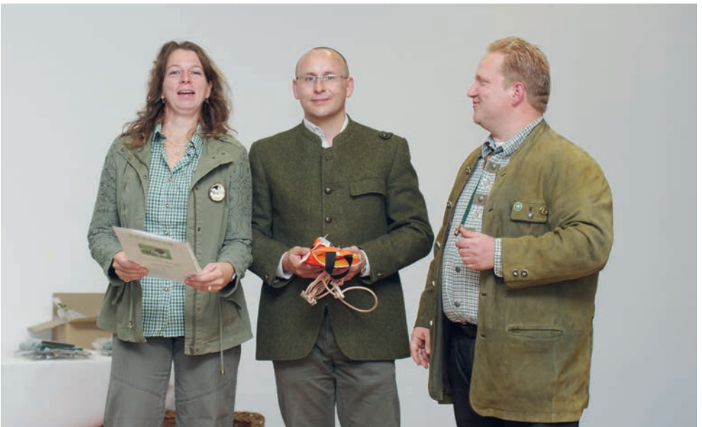
Große Freude über das Ergebnis!