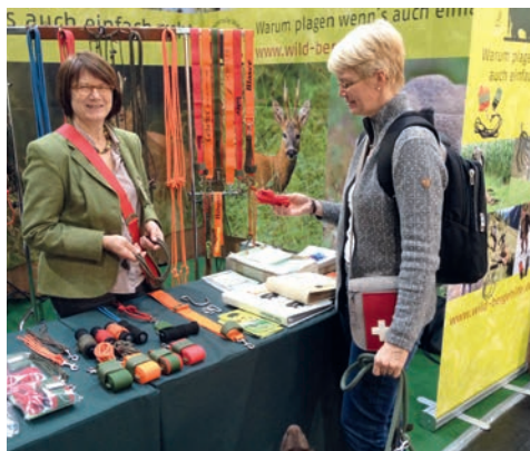
Messestand der Fa. Kurz Wildbergehilfe – Warum plagen wenn's auch einfach geht!