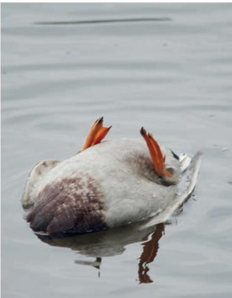
Auch diese Ente findet der Kleine Münsterländer!