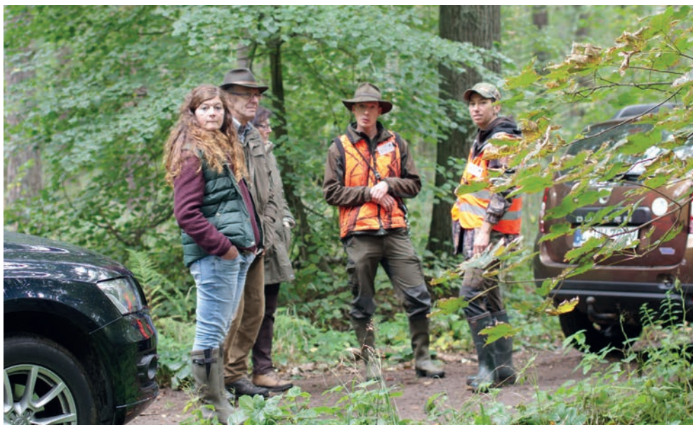
Warten auf den Einsatz!