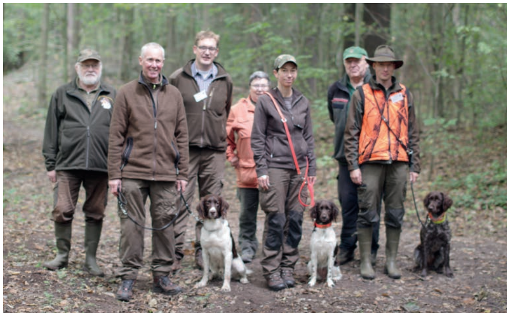
Prüfungsgruppe nach Abschluss der Prüfung!