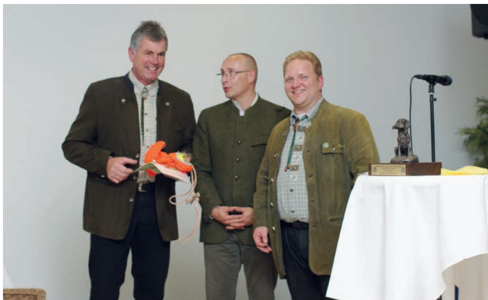
Glücklich über den Erfolg!