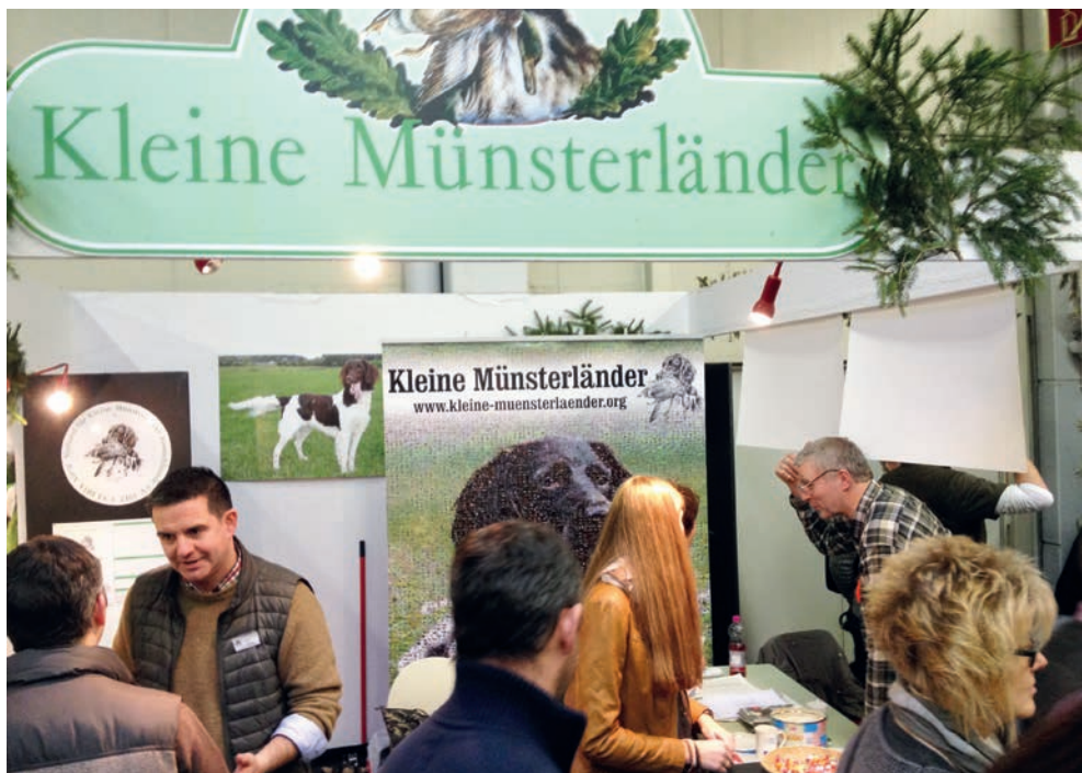
Interessante Gespräche am Stand der Kleinen Münsterländer