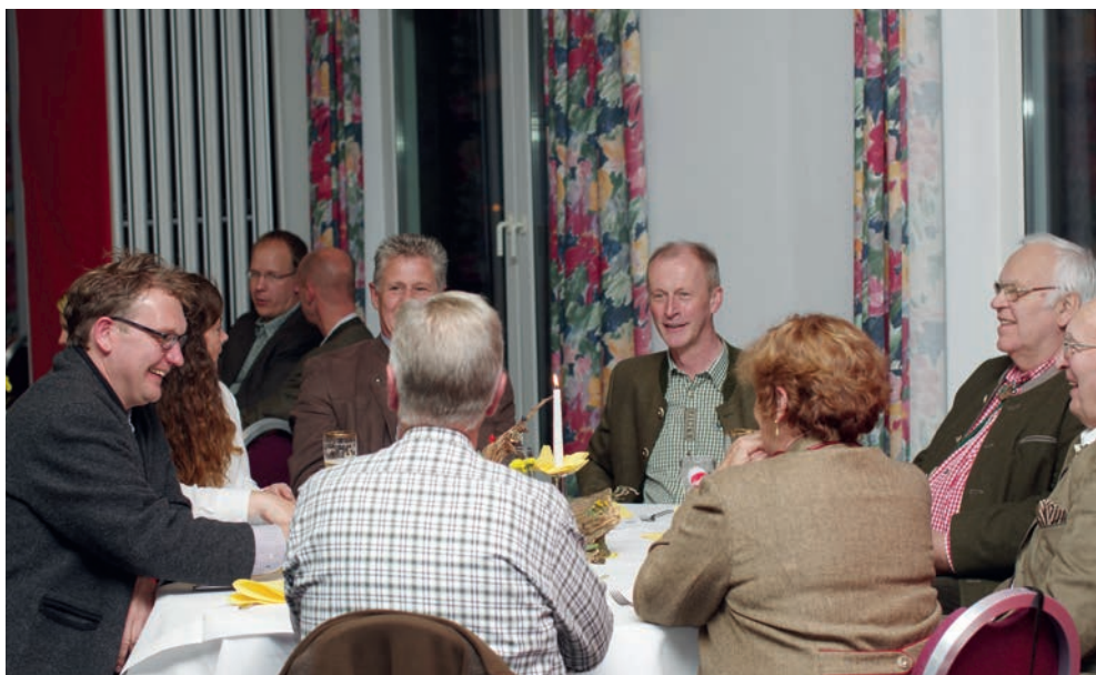
Ein stimmungsvoller Festabend!