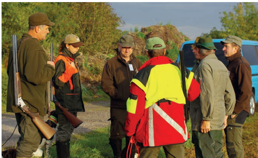
Am 1. Prüfungsmorgen!