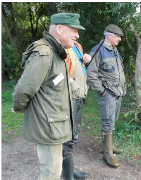
Findet der Kleine Münsterländer die Ente?