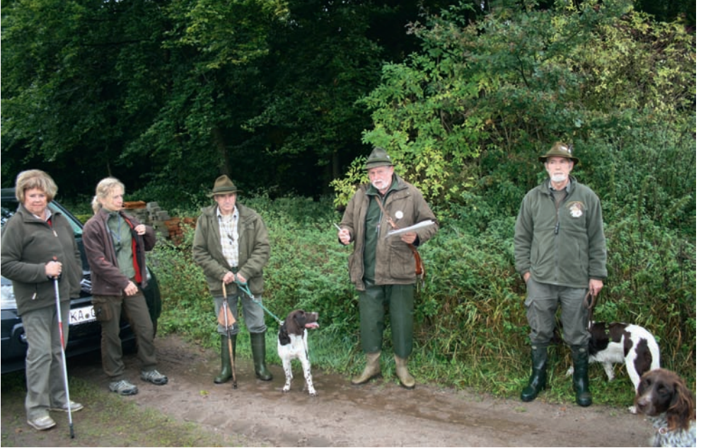
Prüfungsbeginn, Einweisung durch den Richterobmann