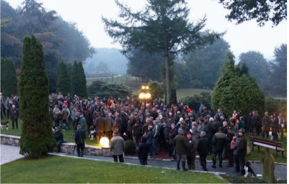
Begrüßung am Prüfungstag in den frühen Morgenstunden