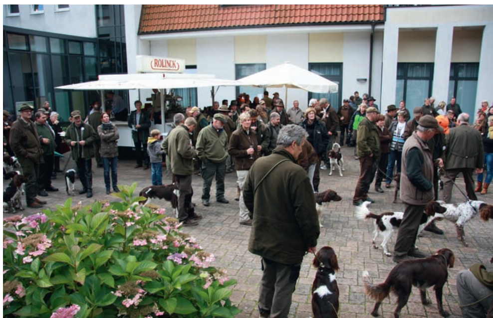
Allseits gute Stimmung am Samstagnachmittag