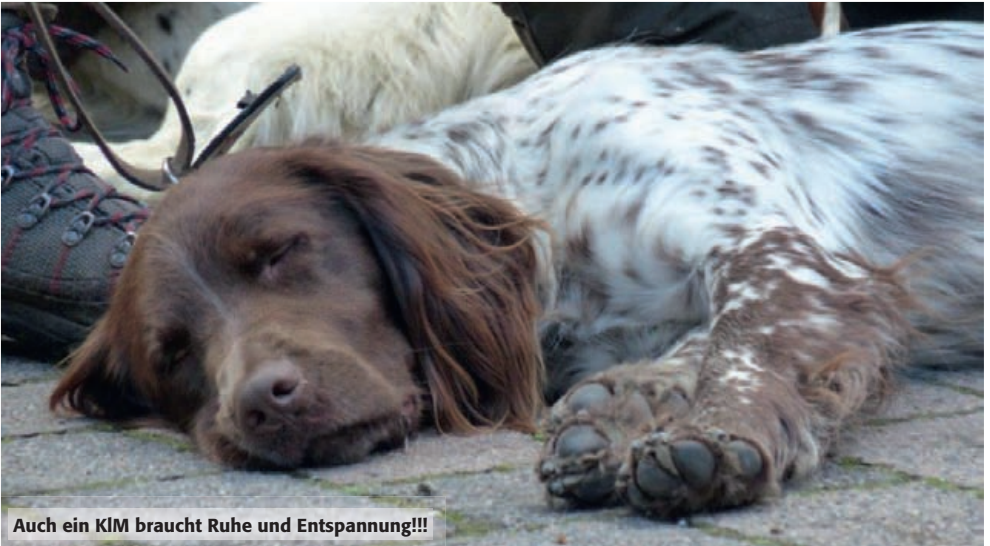
Auch ein KIM braucht Ruhe und Entspannung!!!