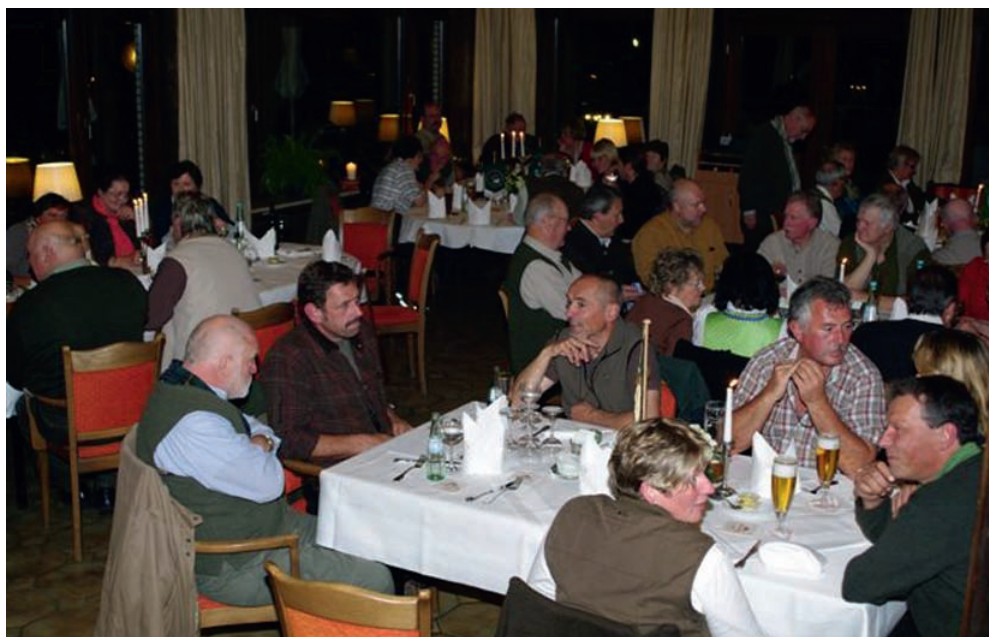
Anstoßen auf den erfolgreichen Prüfungstag beim Münsterlandabend!