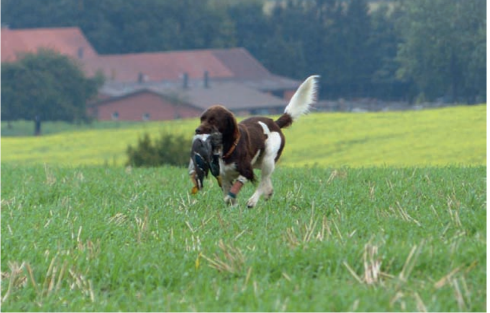
Bringen auf der Federwildschleppe