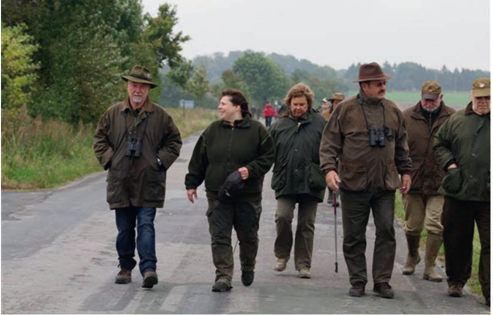
Aufmerksame Beobachter der Paarsuche am Samstag