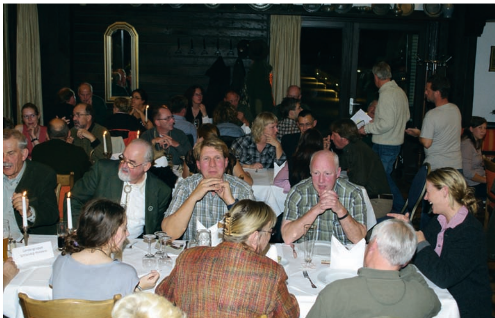
Münsterlandabend am Freitag