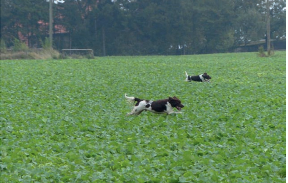
Paarsuche im Feld