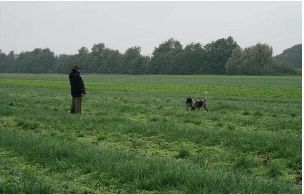
Bringen auf der Haarwildschleppe