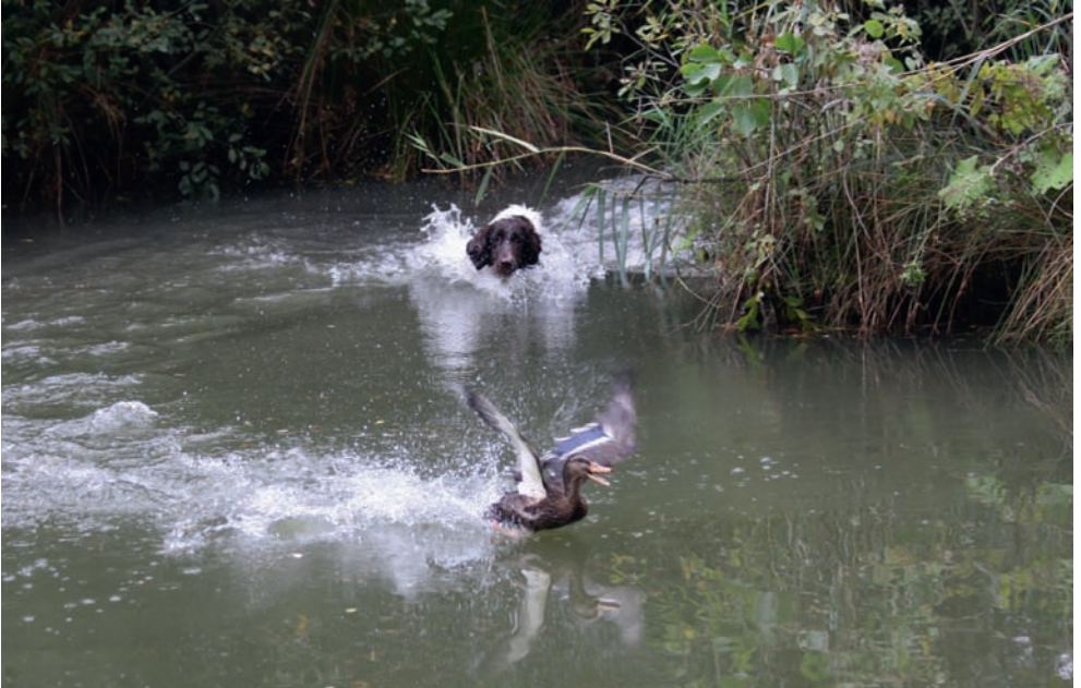
Ente gefunden und vor die Flinte gebracht