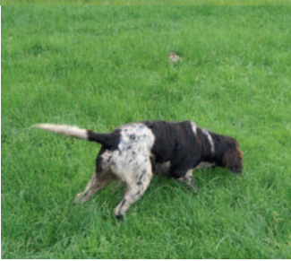
So sieht erfolgreiche Suche aus!!!