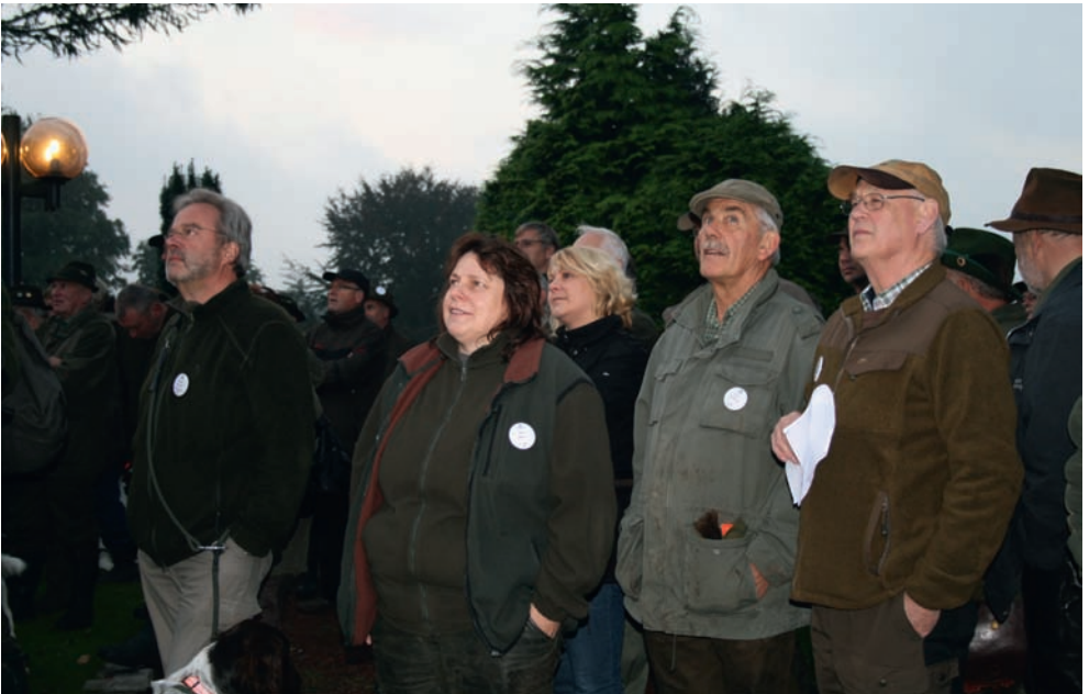
Gespanntes Warten am Prüfungsmorgen