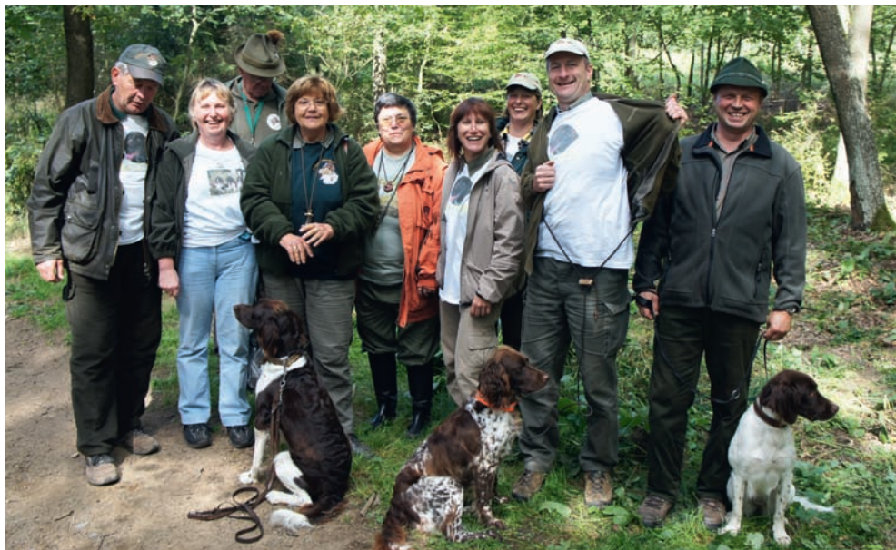
„Fanclub“ der LG Anhalt-Sachsen-Thüringen

Zur Arbeit im „ großen Feld “: Das große Feld war ein weitläufiges Rübenfeld mit einem sehr guten Hasen- und Fasanenbesatz. Das erste Prüfungsfach war die Treibjagd. Alle Hunde der Gruppe (bei uns waren es drei KIM) mussten das Rübenfeld wie bei einer Treibjagd unter der Flinte absuchen. Die Richter konnten so neben der Suche auch das Wesen der Hunde beurteilen (aggressive Hunde hätten die Richter sofort von der Prüfung ausgeschlossen). Anschließend wurde jeder Hund im Rübenfeld einzeln in der Suche geprüft und musste Wild finden und vorstehen. Sowohl bei der Treibjagd wie auch bei der Einzelsuche wurde auf abstreichendes und flüchtiges Wild geschossen.