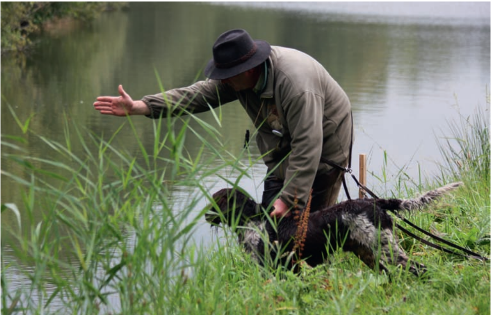
Eine letzte Hilfe für den KIM