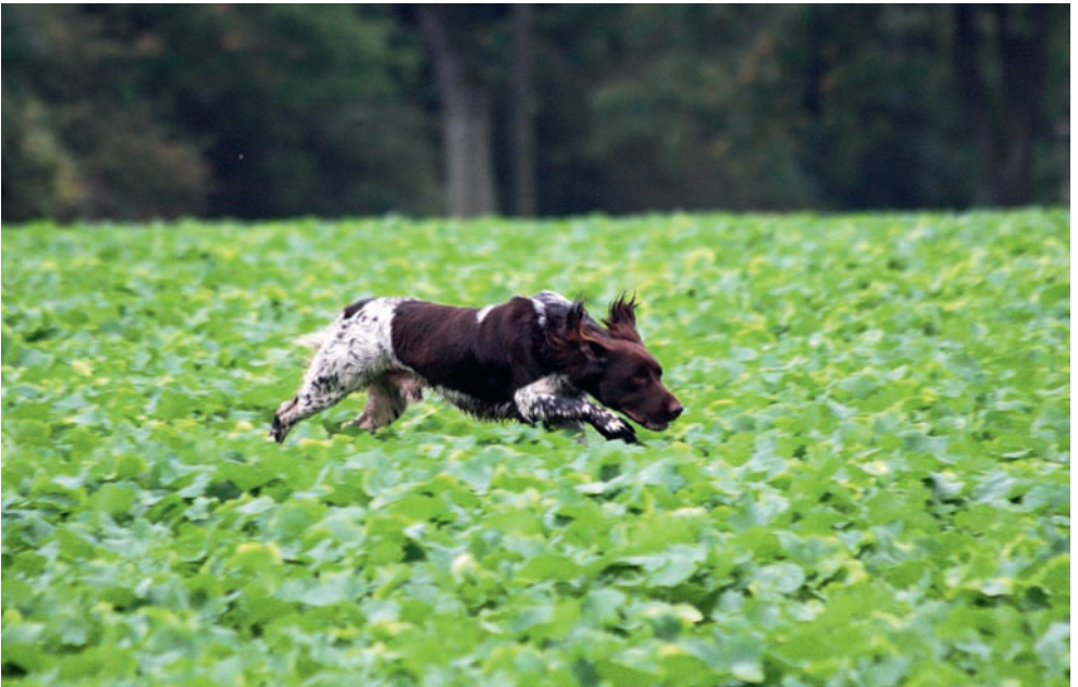
Paarsuche am Samstag. Nur fliegen ist schöner!!!!