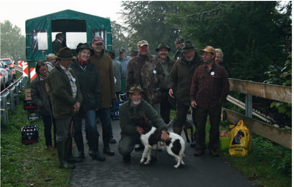
Jede Gruppe wurde mit Lunchpaketen und Getränken am Prüfungstag versorgt