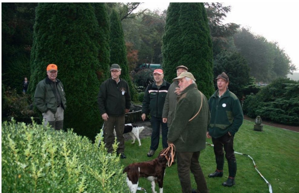
Einteilung der Gruppen