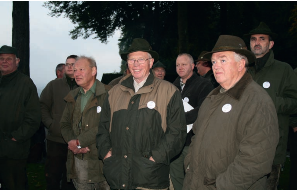
Beste Laune am frühen Morgen!!!!