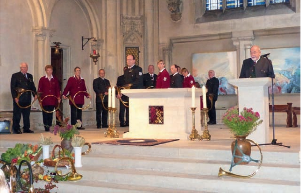
Hubertusandacht zu Ehren des Hl. Hubertus und des Hl. Eustachius