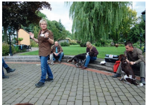
Familien- und Welpenspieltag