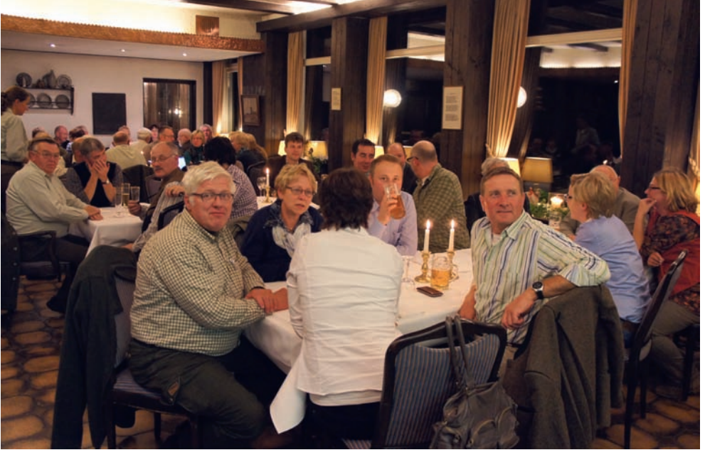
Tolle Stimmung am Münsterlandabend