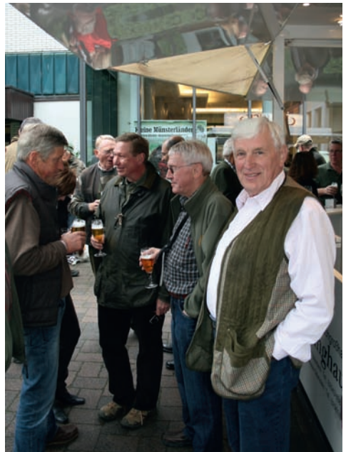
Lockere Gespräche beim Bier