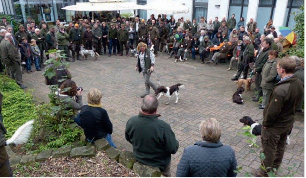
Vorstellung der Teilnehmer durch den Prüfungsleiter am Samstagnachmittag