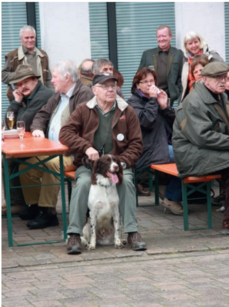
Mittagessen auf dem Gelände der Weissenburg