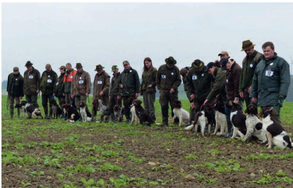
Teilnehmer der Paarsuche