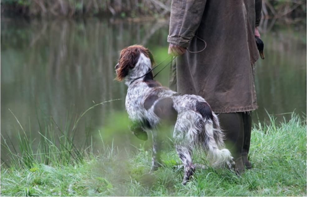
Vorfreude auf die anstehende Wasserarbeit!