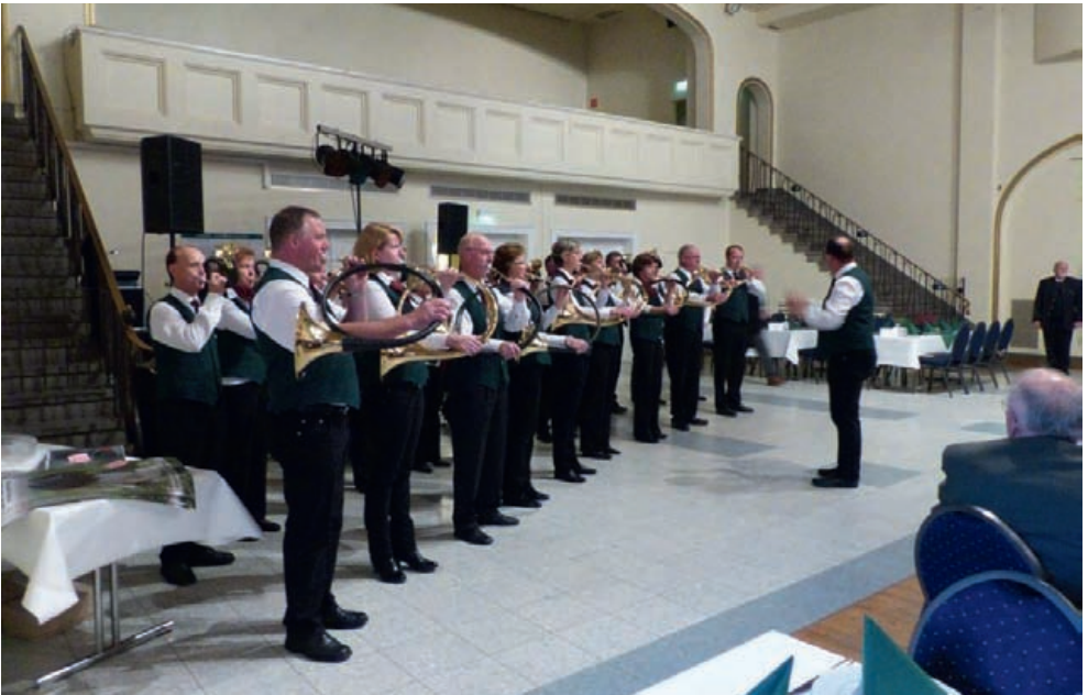
Naturhorngruppe Hubertus Coesfeld am Festabend