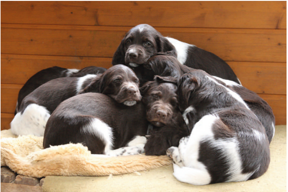
Diese Welpen verbringen in der 8. Lebenswoche bei Temperaturen um den Gefrierpunkt jeden Tag mehrere Stunden im ungeheizten zugfreien Zwinger und gehen erst in der Dämmerung in ihre warme Hütte

Ach wie schön, jeder einzelne Welpe kann sich dort wohl fühlen, wo er gerade liegt! Ohne jeglichen Stress und in aller Ruhe können sie gedeihen. Und fürwahr, solche Welpen scheinen tatsächlich besser zu gedeihen als solche ohne