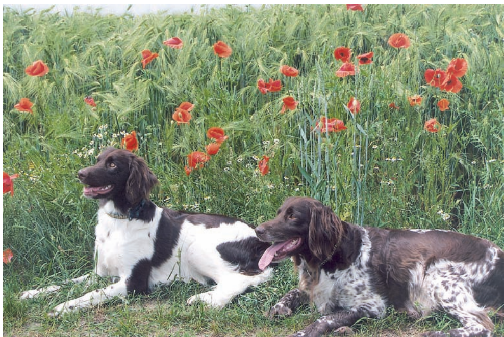
„Klette und Natter vom Rauschenbusch“

Münsterländerheil! Vorstand der LG „AST“