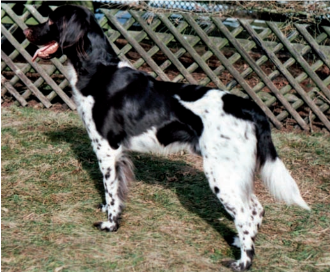
Chicco vom Reckenberger Land, 05-0418