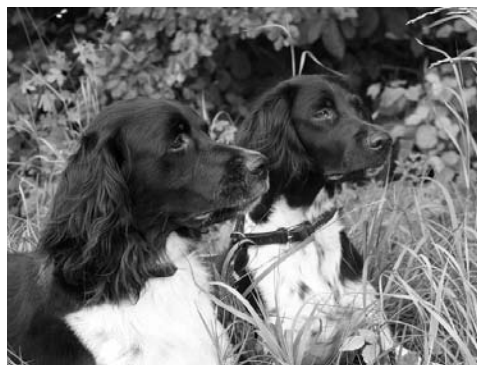
Tristan vom Fuchseck, 5 Jahre, Rüde Varis vom Fuchseck, 2 Jahre, Hündin

Uhlandstr. 23, 73092 Heiningen, Tel. 07161/41190