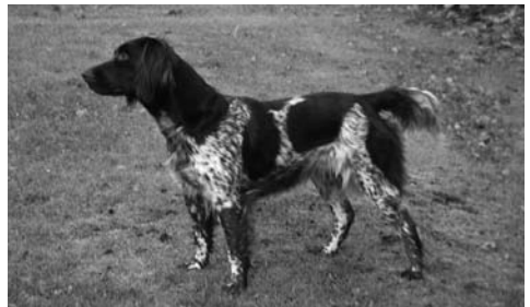
Nele vom Tecklenburger Land, gew. 2003, Hdn, Braunschimmel

DER HUND: Haben Sie besondere Erfolge in Schau oder Sport zu verzeichnen?