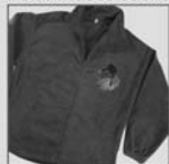
Polar Fleece Jacke