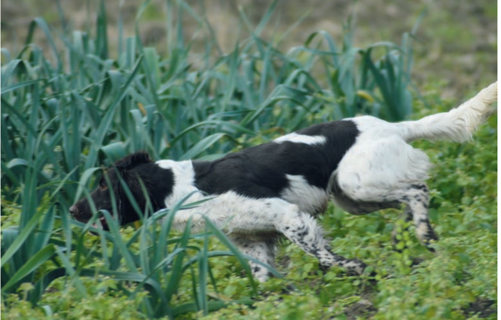
... immer noch