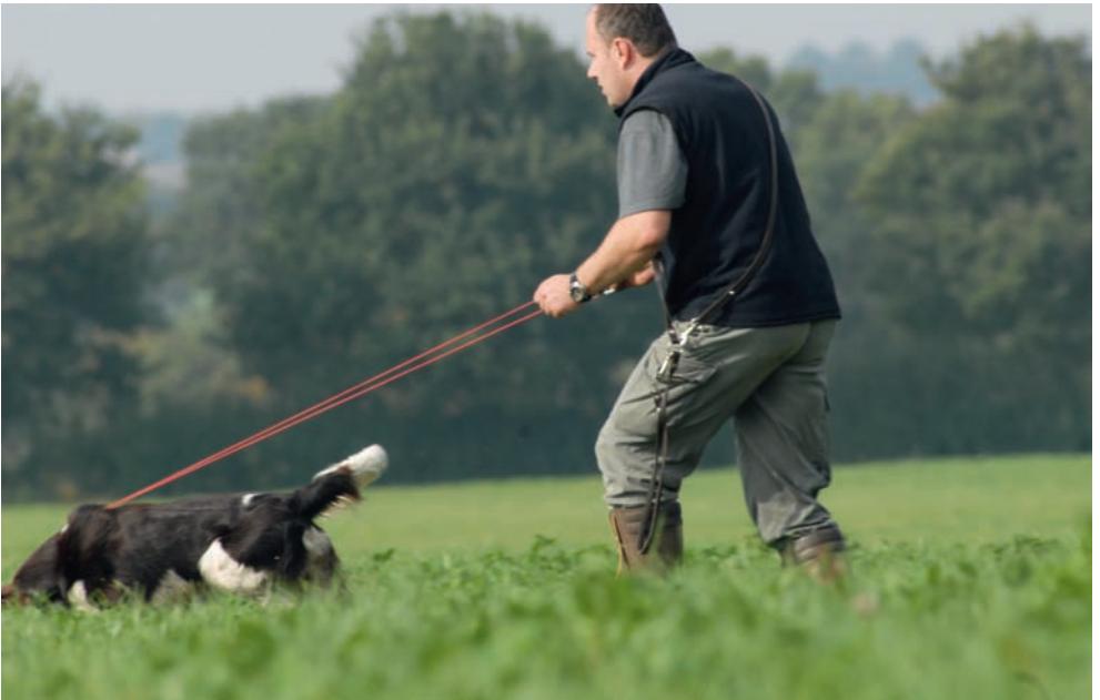
Ansetzen zur Kaninschleppe