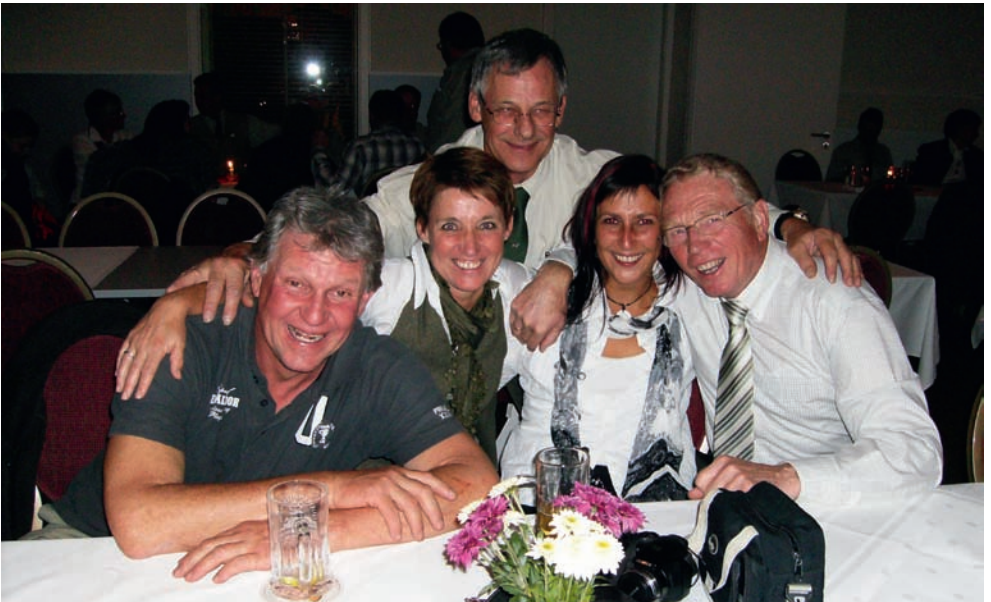
Die Deutsch-Niederländischen Kontakte wurden am Festabend erfolgreich ausgebaut.