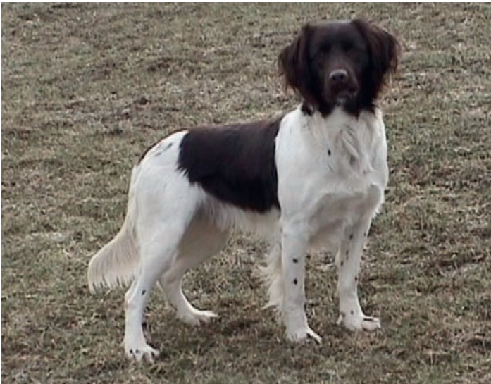
Arko vom Overledinger Moor, 08-1021