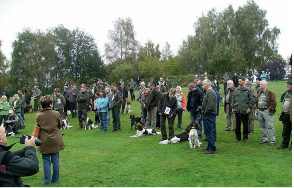
Ein Teil des Zuchtschaugeländes