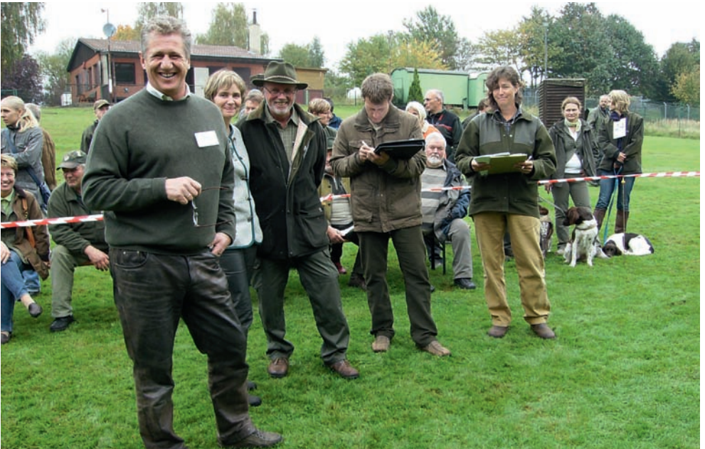
Richtergruppe Ring 2