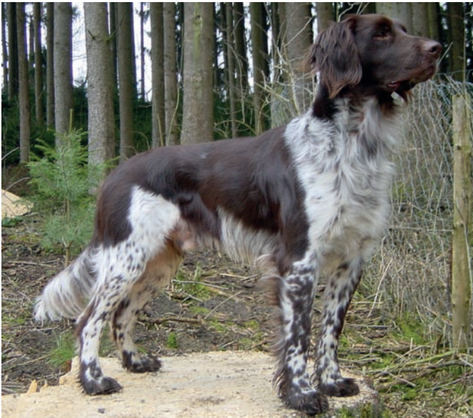
Wilo von der Innleit'n, 08-0271