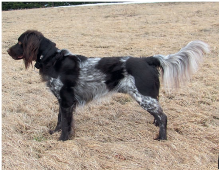
Hasko vom Reckenberger Land, 08-0805