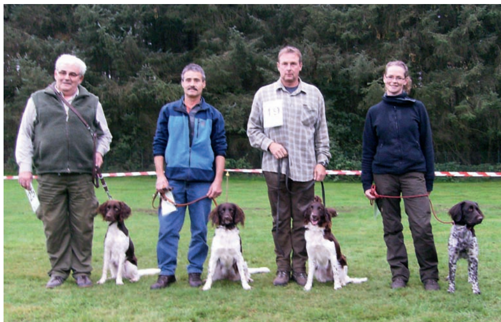
Die vier schönsten Hündinnen