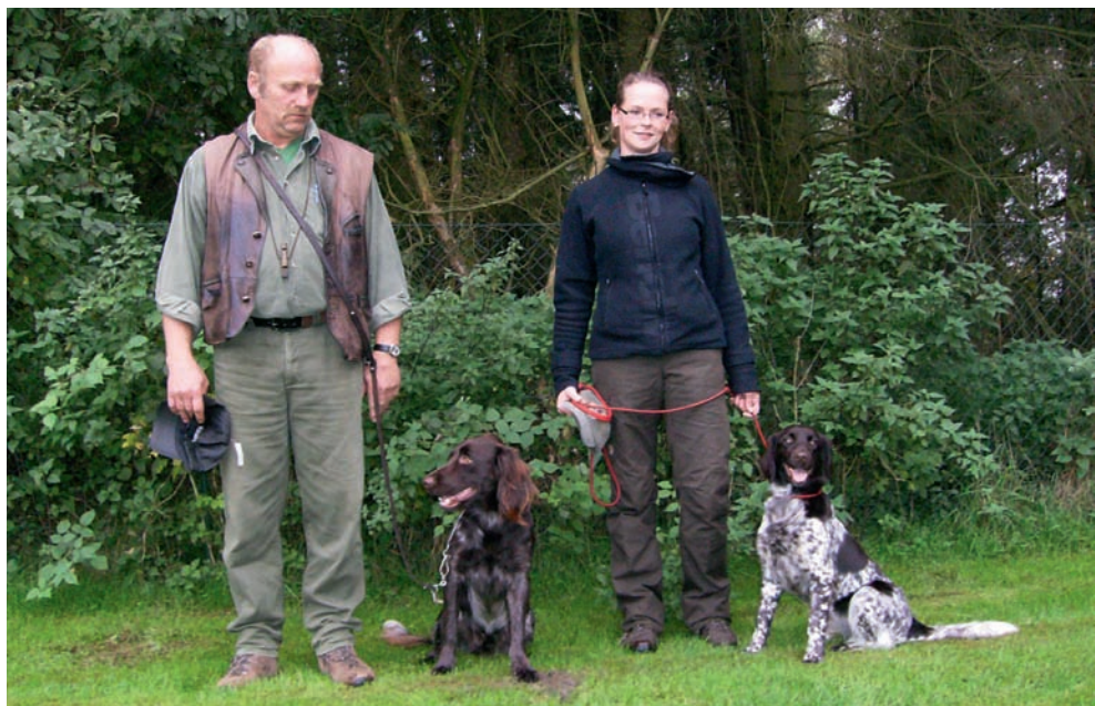
Schönster Rüde und schönste Hündin (von links)