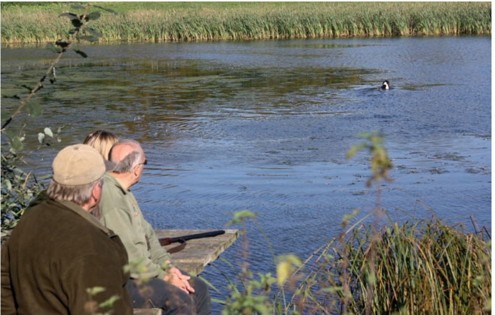
Der Weg zum anderen Ufer ist weit.