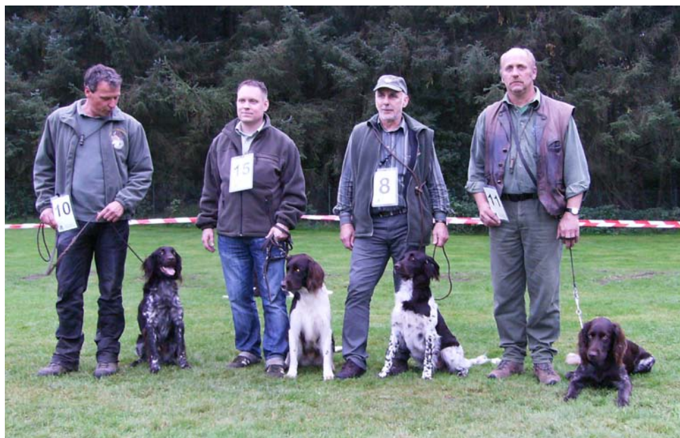
Die vier schönsten Rüden