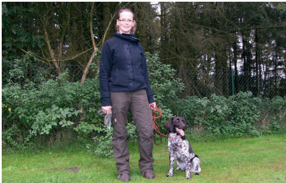
Schönster Hund der Bundeszuchtschau