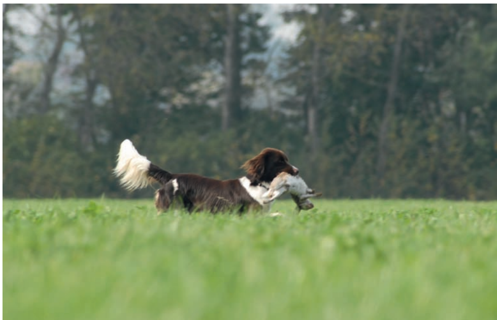
Auf dem Weg zum Führer