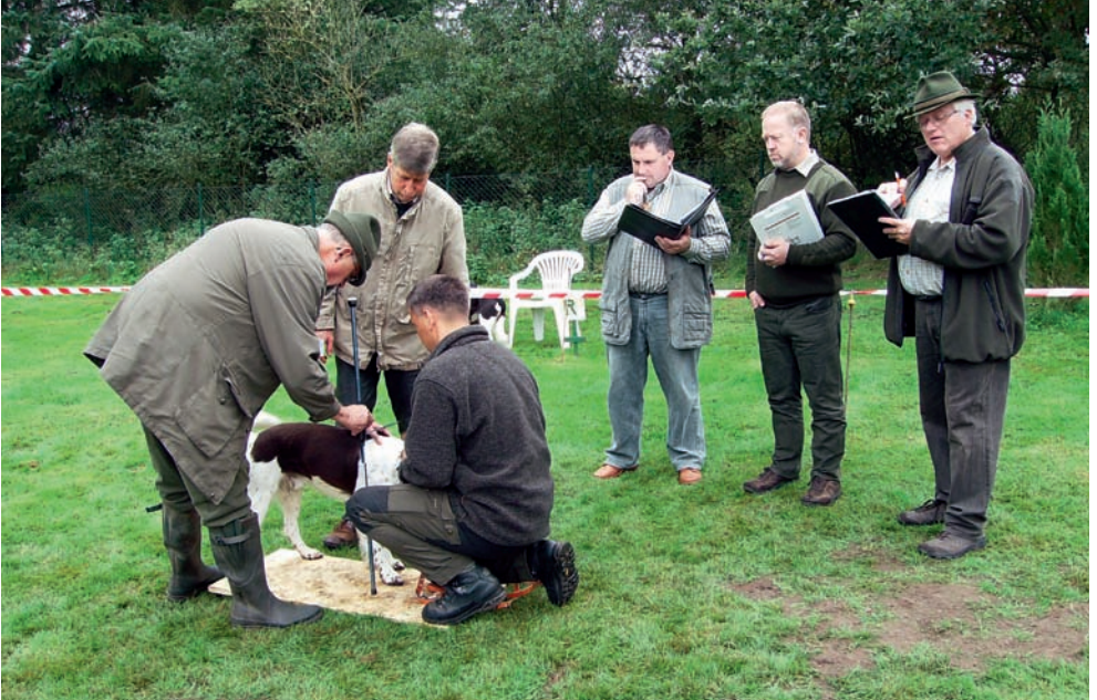
Richtergruppe Ring 1