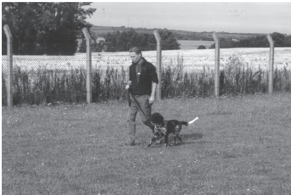
Gehorsamsprüfung vor der Sprengstoffprüfung

In der Anfangsphase der Ausbildung wird das Bringsel in eine Suchwand eingebracht, in der sich auch Sprengstoff befindet. Nach kurzer Suchphase soll der Hund das Bringsel auffinden und über ausgiebiges Spiel zum Erfolg und somit zur positiven Verknüpfung kommen. In der nachfolgenden