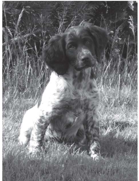
Flora vom Haus Heßling, 12 Wochen, Hündin

DER HUND: Welche besonderen Ansprüche stellen diese Hunde an Haltung und Pflege?