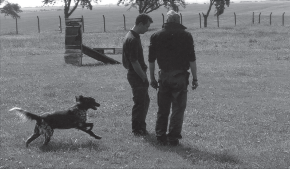
Suche nach Waffen und Patronenhülsen im Gelände