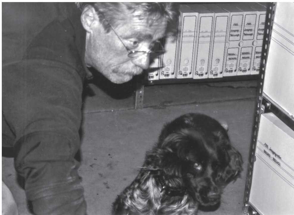
Dorie sucht lange Regale im Landesarchiv Sachsen ab

Ausbildungsphase wird nur noch Sprengstoff versteckt und der Hund lernt über passive Anzeige der Verknüpfung Bringsel und Sprengstoff sein Bringsel zu erhalten.