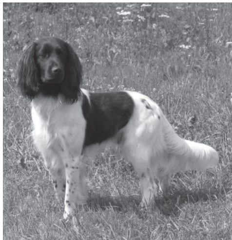
Flott vom Federbachsee, 7 Jahre, Rüde

Bieg: Temperamentvoll und ausgeglichen, gute Nervenstärke.