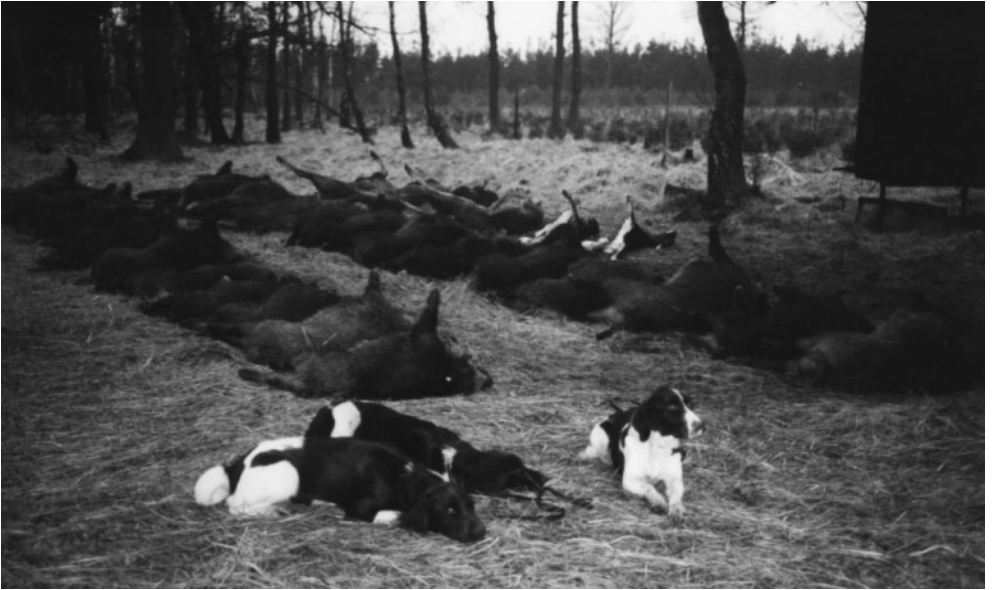
Kleine Münsterländer nach erfolgreichem Einsatz auf einer Bewegungsjagd LG Westfalen-Lippe