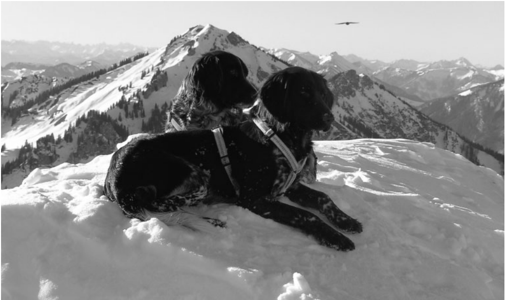
Bernhard Haubers „Weiber“ auf dem Hochfellngipfel, im Hintergrund der Gipfel des Hochgern.