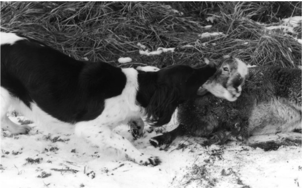
Kleiner Münsterländer nach erfolgreicher Nachsuche mit Hetze auf ein Schmalschaf mit Laufschuss LG Anhalt-Sachsen-Thüringen