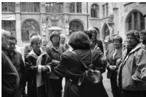
Innenhof Historisches Rathaus

Anschließend machten wir einen Spaziergang – vom Isartor, vorbei am Viktualienmarkt, zum Marienplatz, besichtigten das historische Rathaus mit dem Glockenspiel, die Mariensäule, den Fischbrunnen und besuchten Münchens Stadtkirche, den Alten Peter. Gerne hätten wir natürlich noch einen ausgedehnten Einkaufsbummel in Münchens Feinkosttempel, dem Dallmayr, gemacht. Leider reichte dazu die Zeit nicht mehr, waren wir doch bereits zum Mittagessen im Spatenhaus, gegenüber von Nationaltheater und Residenz, angemeldet. Dort holte uns nach einer stärkenden Pause der Bus wieder ab. Vorbei an Olympiaturm