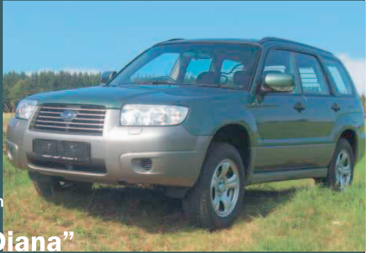
Abb.: Forester "Active" mit Nebellampen