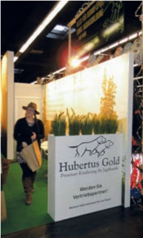
Messestand der Fa. Hubertus Gold – Werbepartner der Kleinen Münsterländer