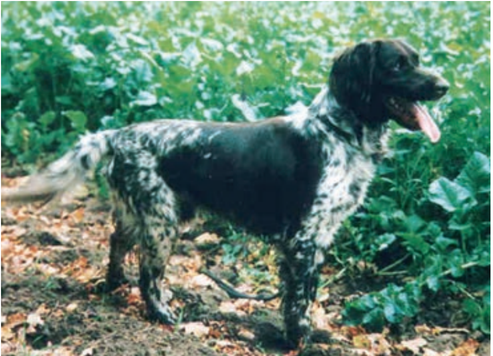
Nero vom Eusternbach 98-0835, † 08.01.2015