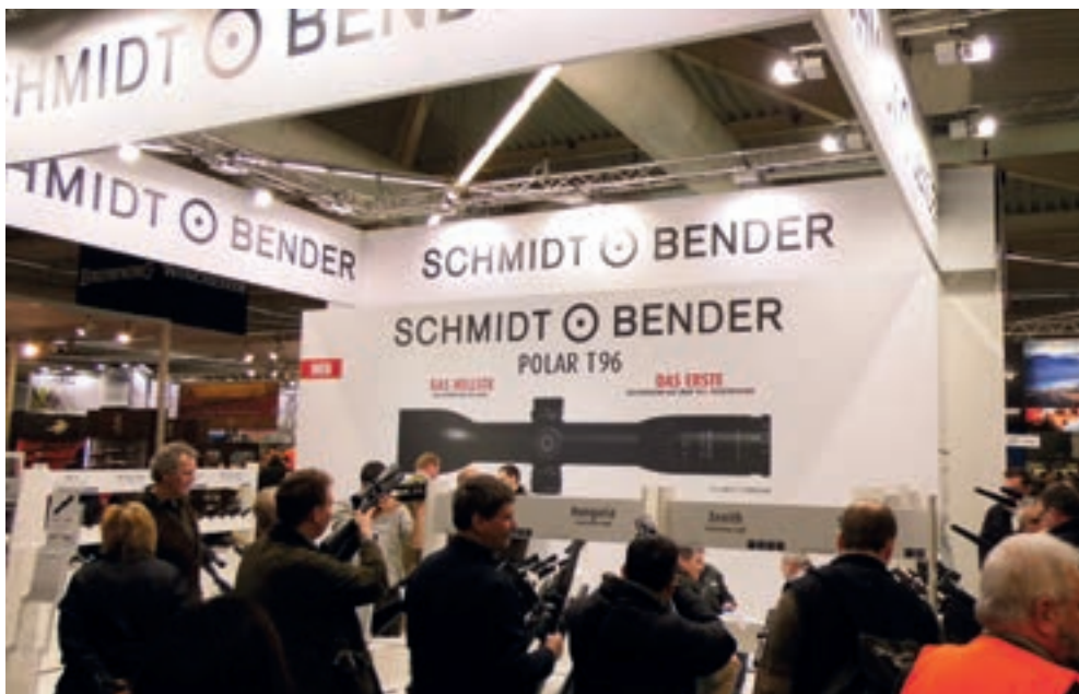
Neuigkeiten auf dem Messestand der Fa. Schmidt & Bender – Werbepartner der Kleinen Münsterländer