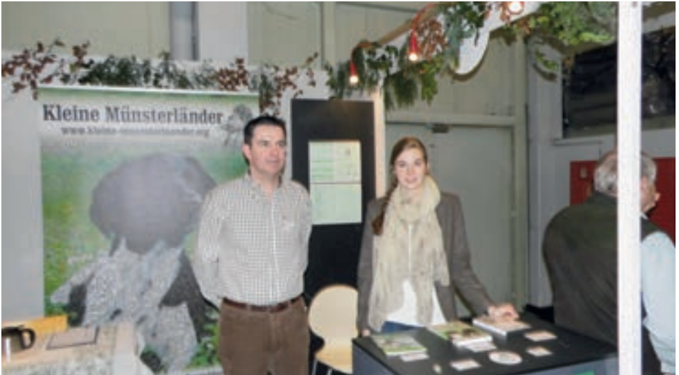
Messestand der Kleinen Münsterländer in Halle 8