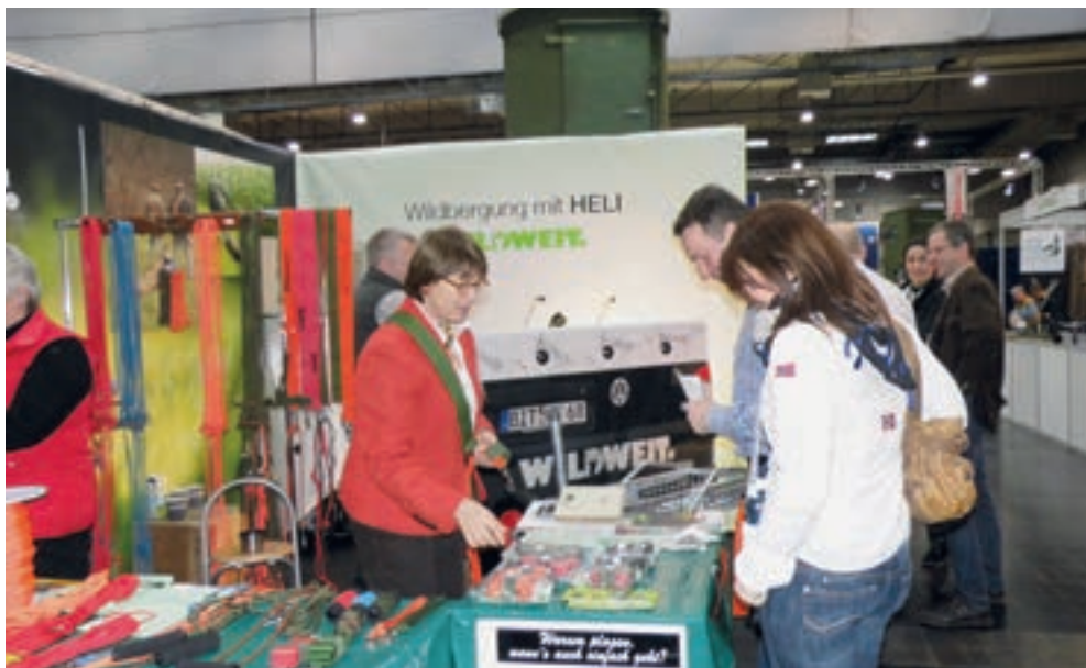
Messestand der Fa. Kurz Wildbergehilfe – Werbepartner der Kleinen Münsterländer