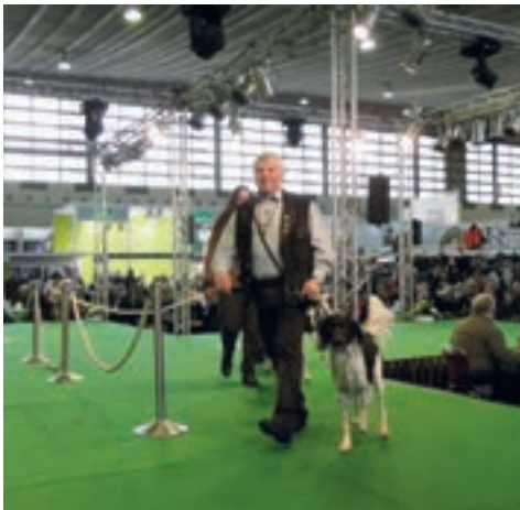
Vorstellung der Kleinen Münsterländer in Halle 4