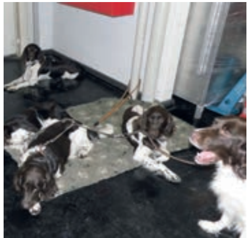
Trotz Messetrubel völlig entspannt!