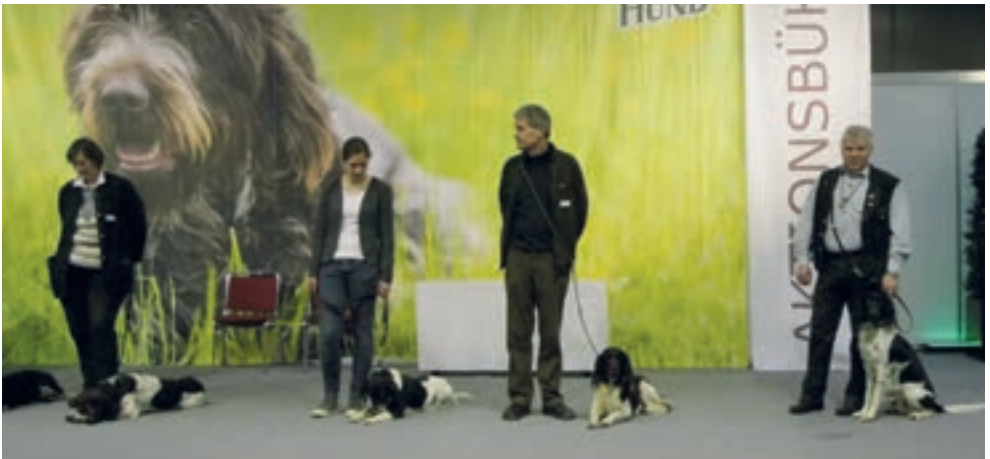
Aktionsbühne in Halle 8