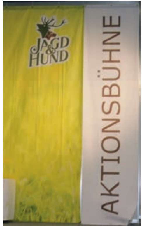
Aktionsbühne in Halle 8