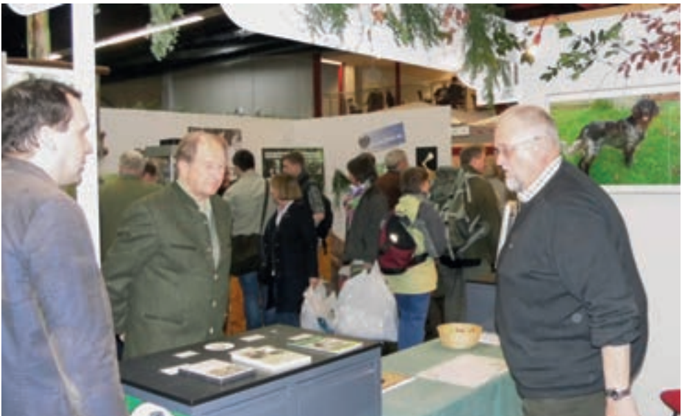
Interessante Gespräche am Stand der Kleinen Münsterländer