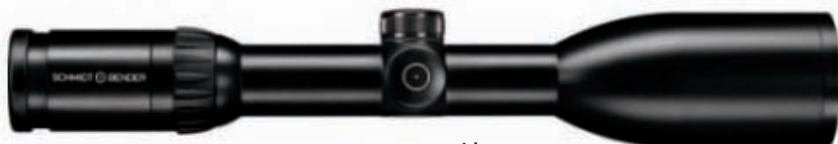
3-12 x 50 Zenith

Warum die Absehenbeleuchtung von Schmidt & Bender mit einer automatischen Abschaltung ausgestattet ist, erklärt sich leicht: ein Großteil der Mitarbeiter ist selbst Jäger. Sie sammeln eigene Erfahrungen und die von Jagdfreunden und Kunden in aller Welt. Systematische Entwicklungsarbeit, ausgiebige Praxistests und regelmäßige Gespräche mit Waffenherstellern, Büchsenmachern und Schützen leisten ein Übriges, um neue Lösungen zu erzielen. Zur besonderen Sicherheit laufen dabei alle Prozesse, von der Konstruktion über die Fertigung bis zum Service, nach den strengen Regeln des Qualitätsmanagement-Systems gemäß DIN ISO 9001:2000 ab. So meistern die Mitarbeiter von Schmidt & Bender ihre selbst gesetzte Herausforderung: die Ansprüche der Kunden nicht nur zu erfüllen, sondern zu übertreffen. Denn der Kunde ist König!