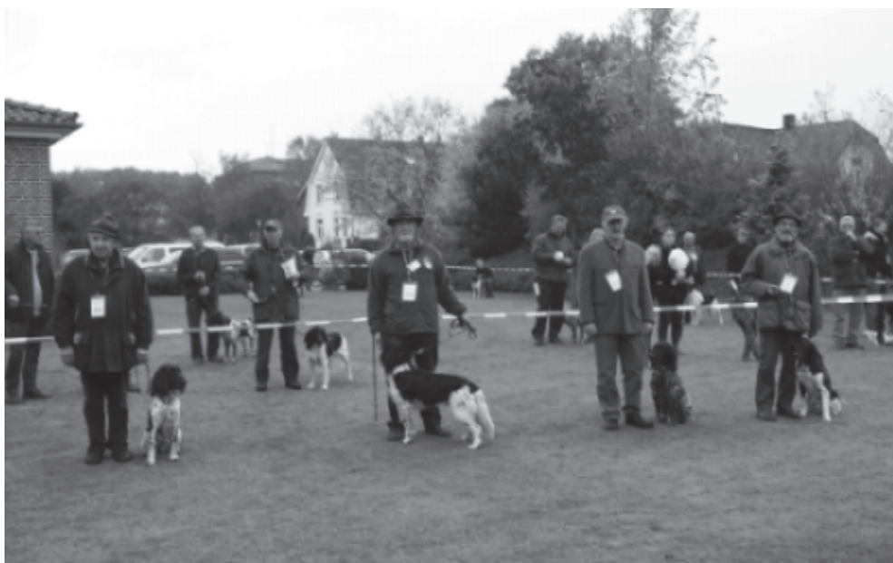
Die 4 schönsten Rüden