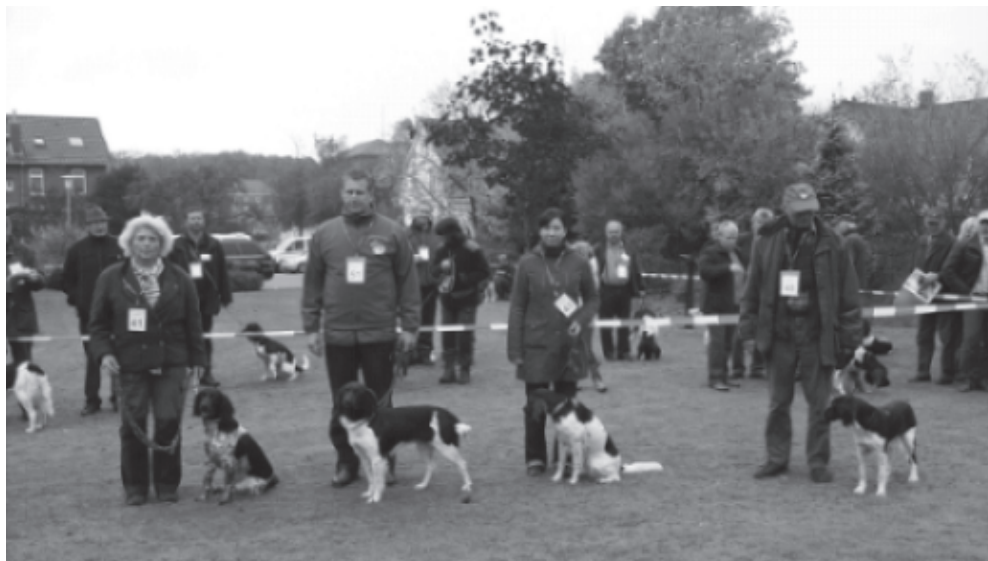
Die 4 schönsten Hündinnen