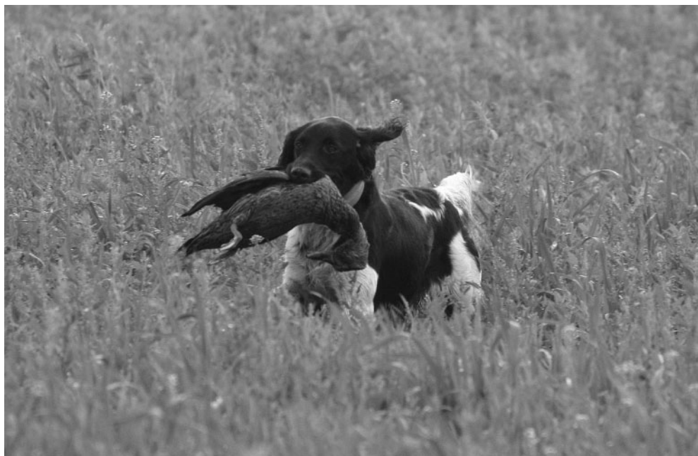
Auf der Federwildschleppe