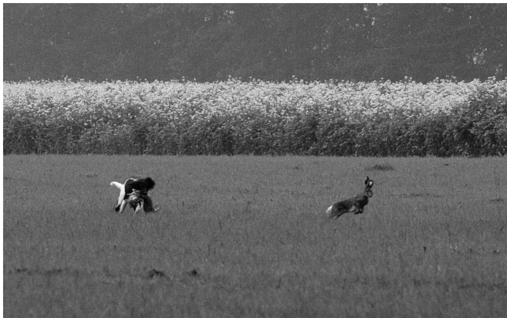
Auf dem Rückweg der Haarwildschleppe, das „erfreut“ jedes Führerherz