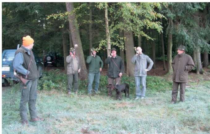
Begrüßung zur IMP

Zur Prüfung erschienen 12 Kleine Münsterländer und 3 Große Münsterländer Gespanne aus Deutschland, Frankreich, Niederlande, Belgien und Österreich. Geprüft wurde nach der vorläufigen Prüfungsordnung (Entwurf Stand: Juli 2011) für Internationale Münsterländerprüfung (IMP). Die Internationale Münsterländerprüfung wird eine