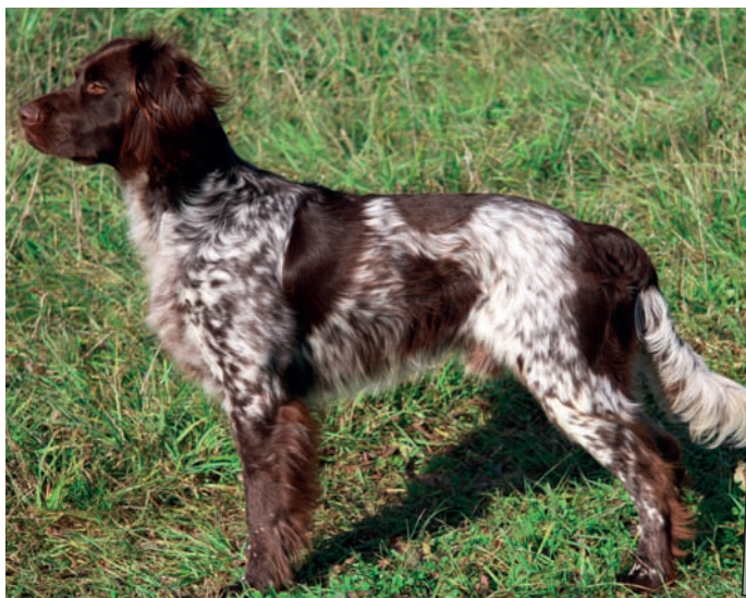
Cinjo vom Weiherberg, 09-0348