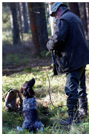
Es kann losgehen!!