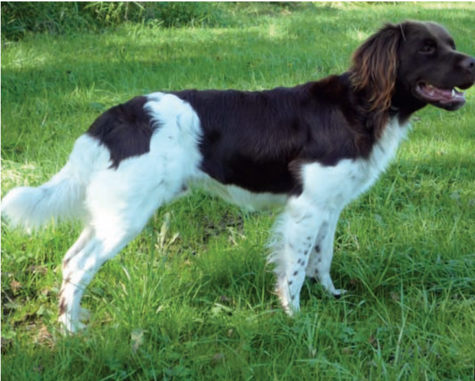
Caesar vom Steinhügel, 09-0206

Gew. 20.02.2009 Braun-weiss Sil. HN. VJP: 72 Pkt. HZP: 177 Pkt. VGP: 302 Pkt., 3 Pr., ÜF HD: A HQ: 0,96 Zuchtschau: SG-V 55 cm Besitzer: Gerhard Tank, Gartenstr. 27, 37170 Uslar-Dinkelhausen, Tel. 05571/7880, 0173/3086853 Gerhard.Tank@t-online.de LG: Hannover-Braun- schweig