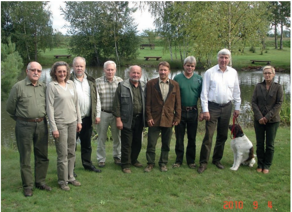
Das Vorbereitungsteam zur B-VSWP der LG

Das nächste Mal kann das Alles ganz anders aussehen!