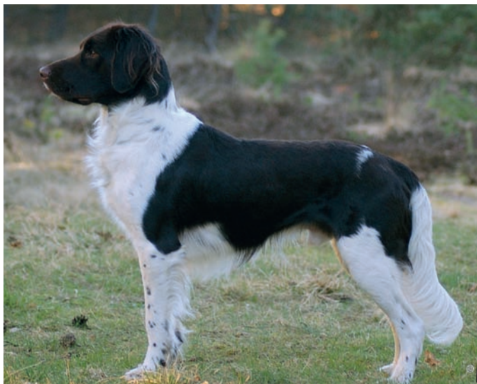
Larcchan vom Forstweg, 09-0051