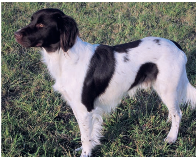
Charly vom Weiherberg, 09-0349