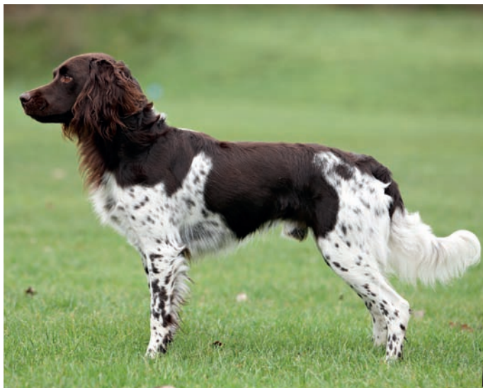
Fuglevang's Jack, DK 097077-2009