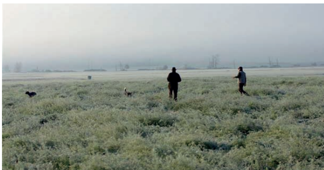
Paarsuche im Feld