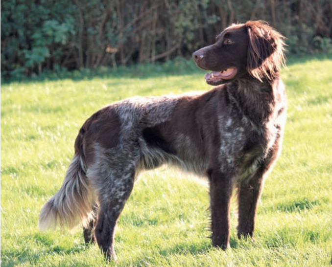
Amor von der Sonnenseite, 08-0924

Gew. 22.10.2008 Braunschimmel Sil., BTR. VJP: 70 Pkt. HZP: 174 Pkt. u. 178 Pkt. VGP: 332 Pkt., 3. Pr., ÜF Totverweiser VGP: 321 Pkt., 1. Pr., TF HD: A HQ: 0,99 Zuchtschau: SG-SG 56 cm Besitzer: Veronika Häck, Im Fahrholz 20, 92253 Schnaittenbach Tel. 0176/21189221, 0170/4762011 vroni.haeckl@googlemail. com LG: Nordbayern