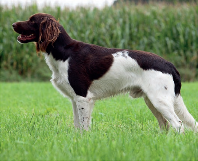
Karlo vom Grenzwall, 10-0660