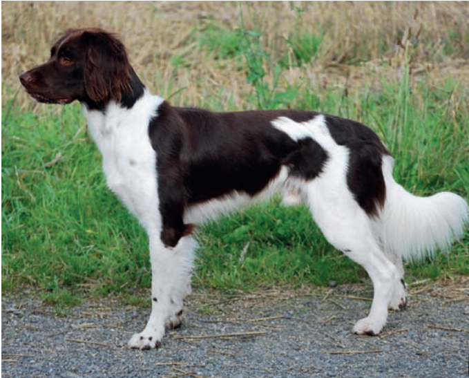
Rick vom Schwarzen Moor, 09-0090