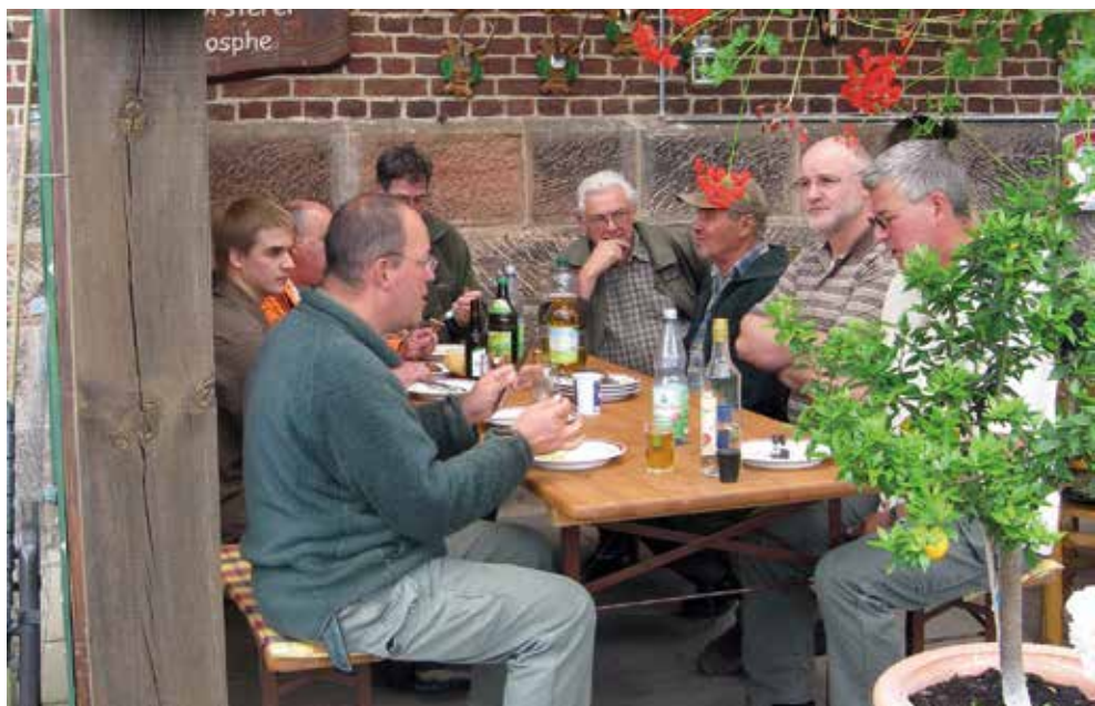
Gemütliches Beisammensein nach einer Prüfung im Garten des Prüfungsleiters