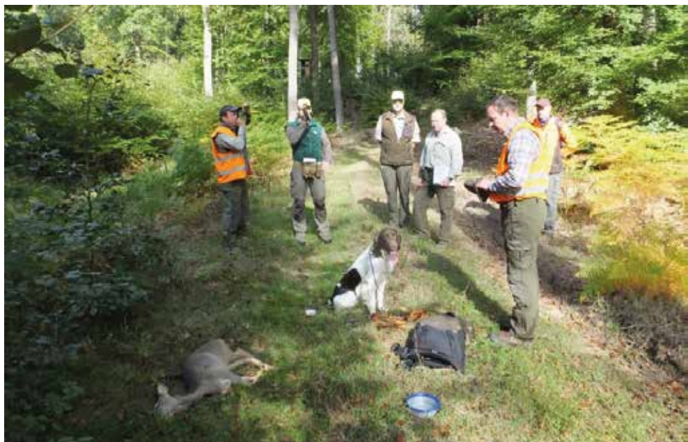
Erfolgreich am Stück angekommen