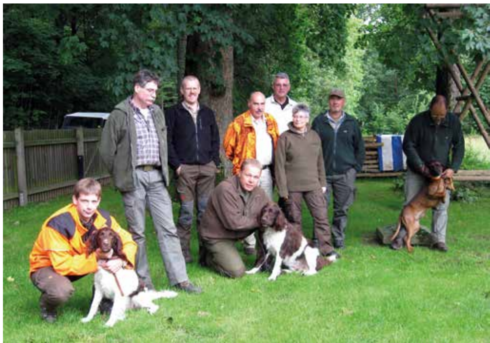
Prüfungskorona der VFsP 2012