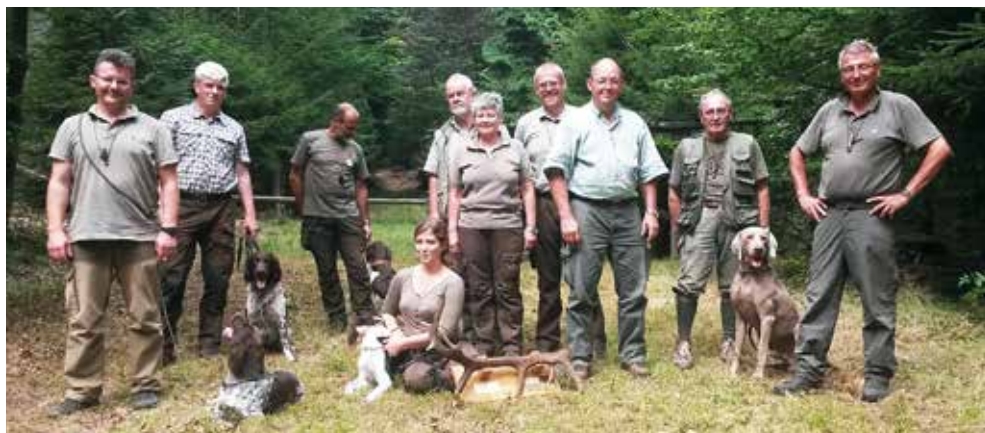
Die Prüfungskorona der VFSP 2014