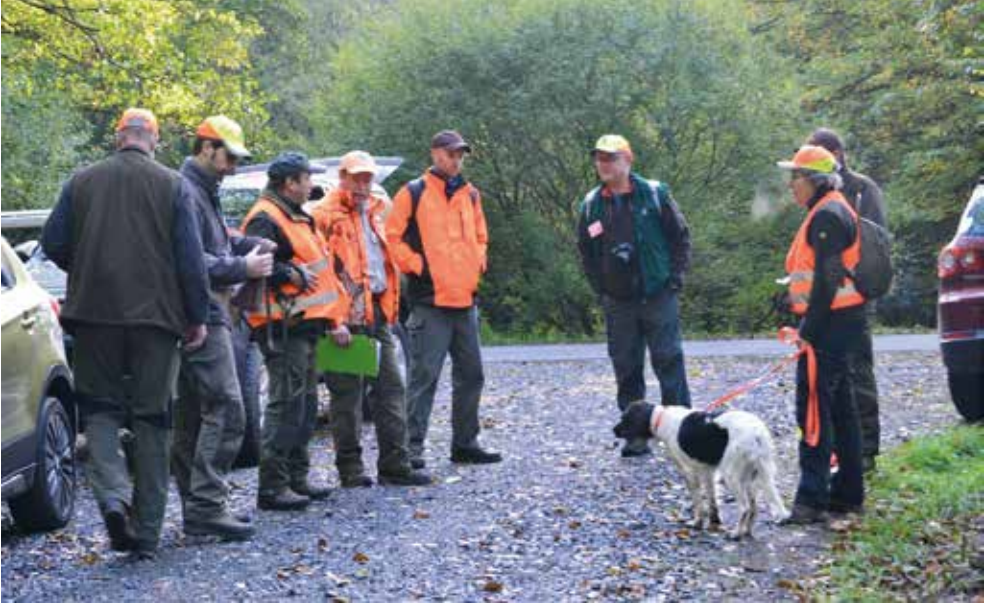
Richtergruppe 1: Aufbruch zur 1. Fährte