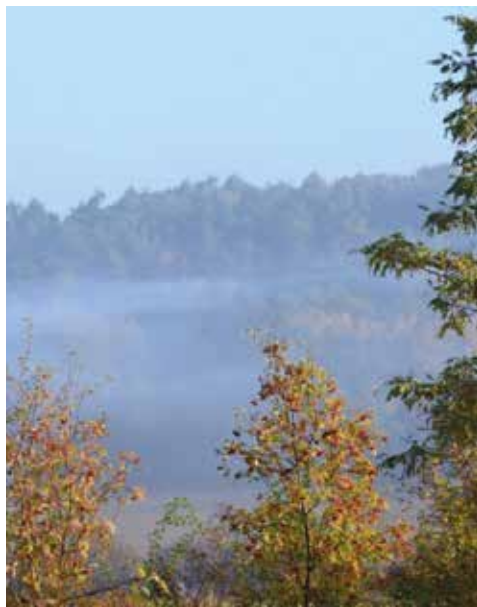
Bestes Wetter am Prüfungsmorgen