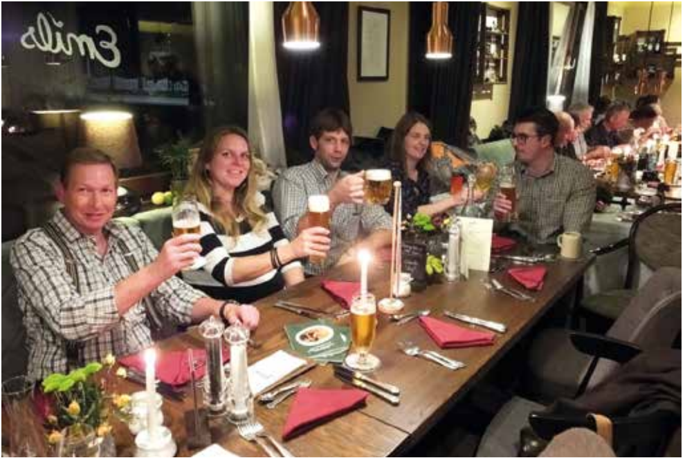
Hessen beim Feiern