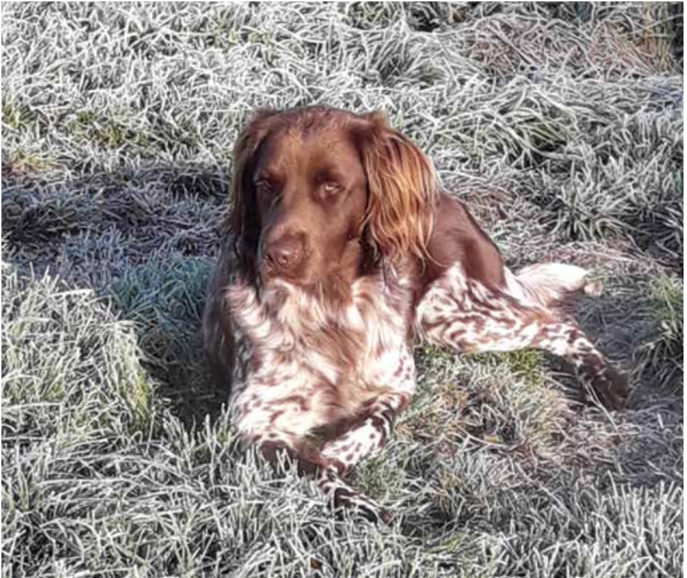
Dexter vom Stiftsforst