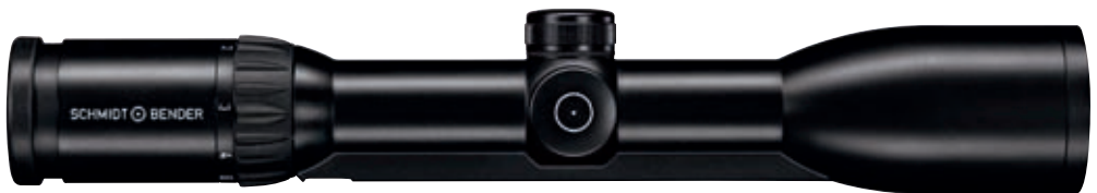
1,5-6 x 42 Zenith

Das universelle Zielfernrohr aus der Zenith Linie überzeugt durch seine Vergrößerung, den Objektivdurchmesser und das große Sehfeld, während sein harmonisches Äußeres es zur idealen Wahl für kombi-