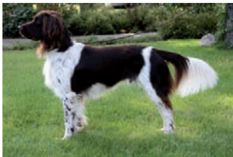
Schönster Rüde „Gauner vom Vechtetal“