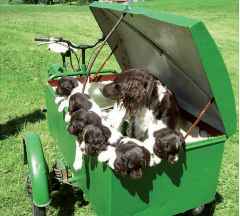
D-Wurf von der Hammerschmiede